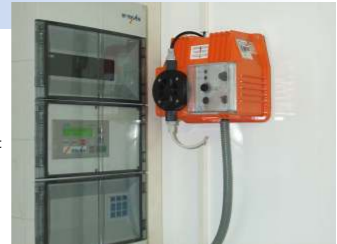
Schaltschrank mit Dosierpumpe